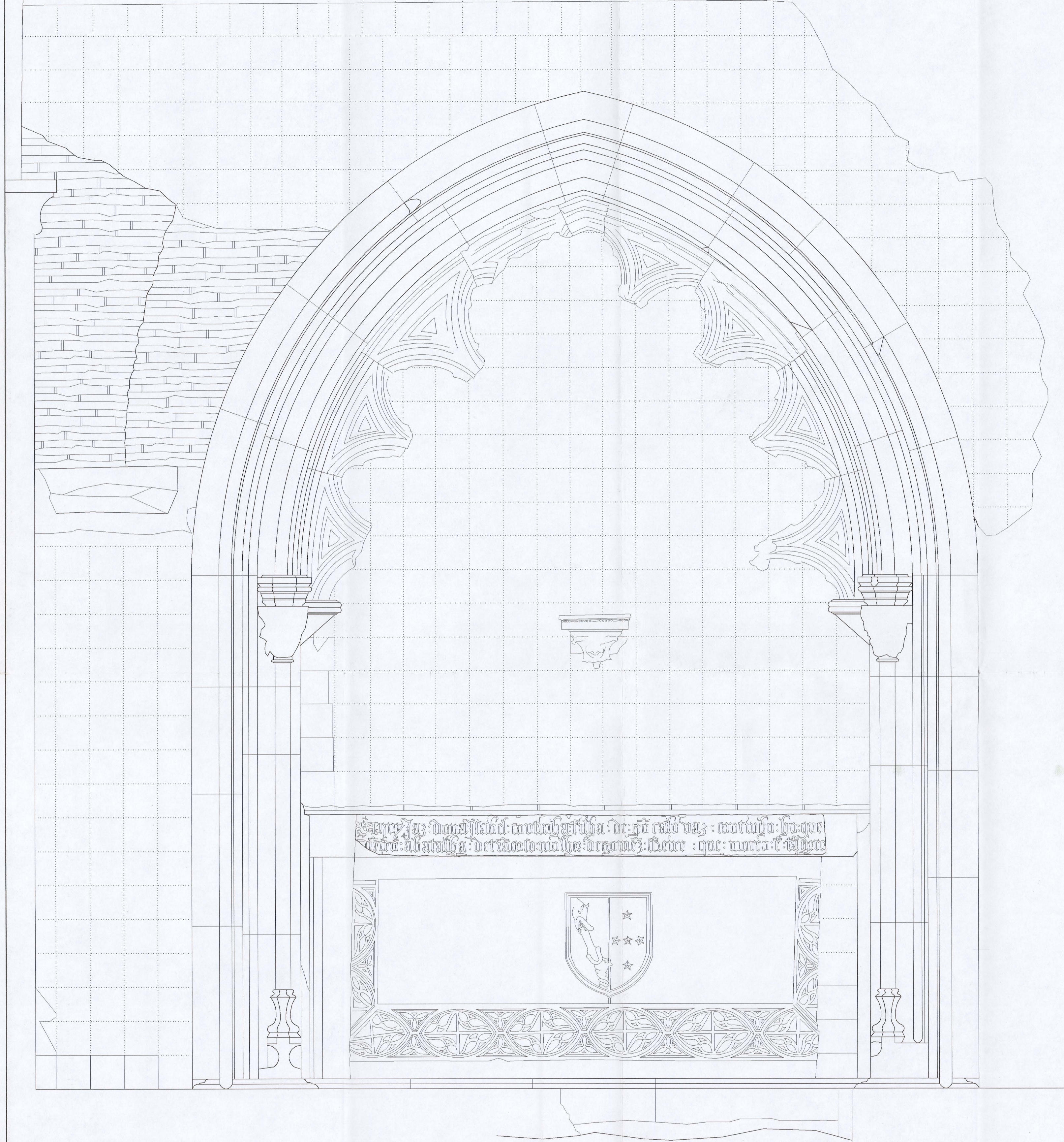
ALÇADO DA SEPULTURA PARIETAL