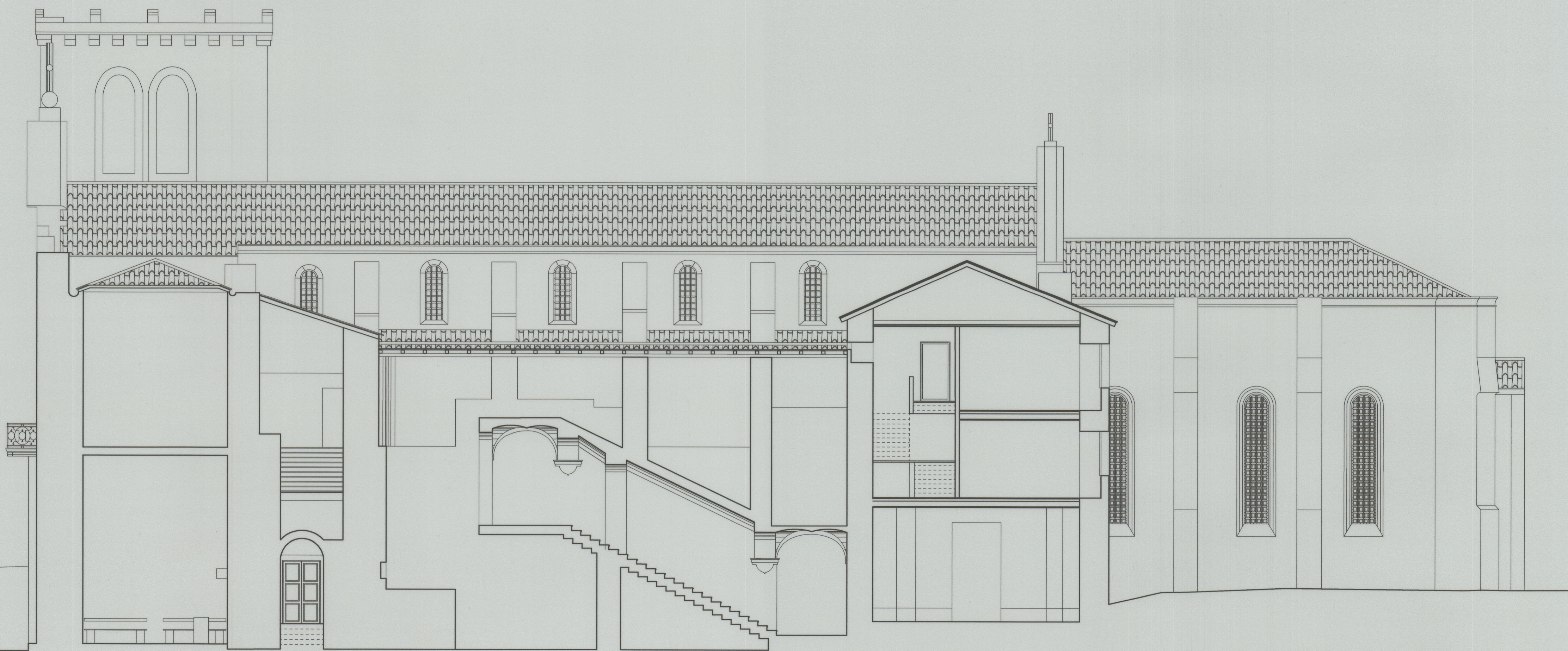
CORTE J - J