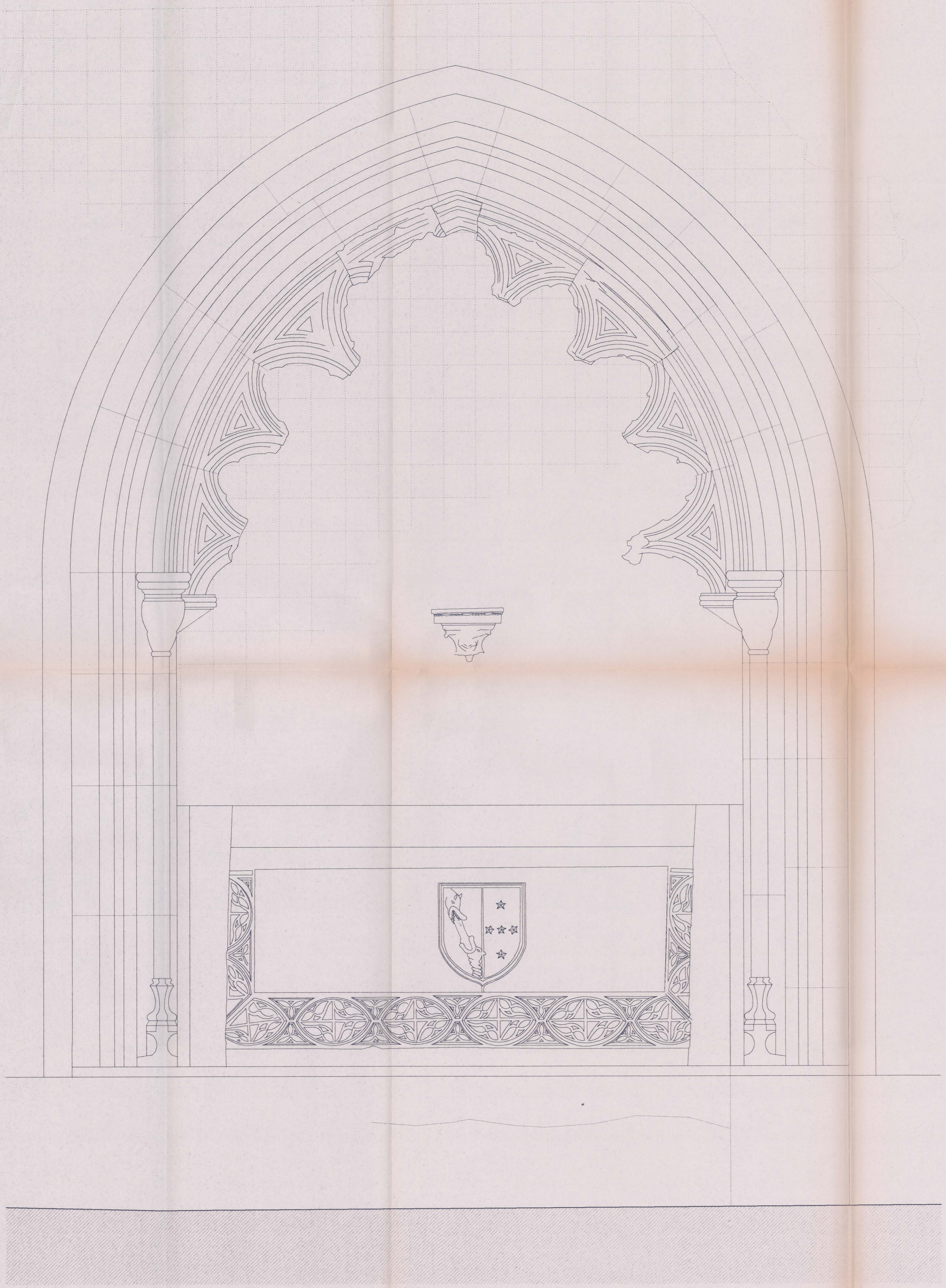
ALÇADO DA SEPULTURA PARIETAL