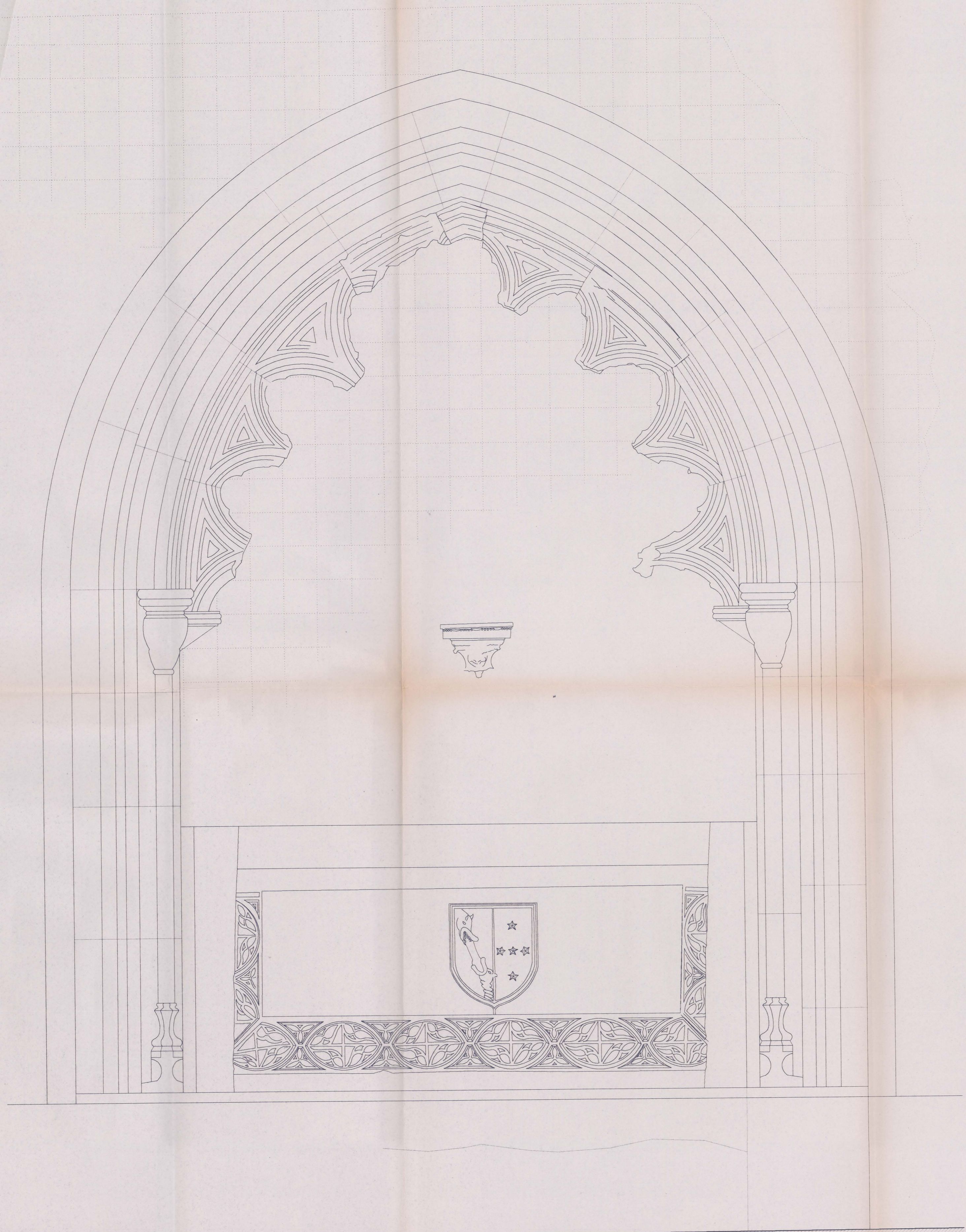
ALÇADO DA SEPULTURA PARIETAL