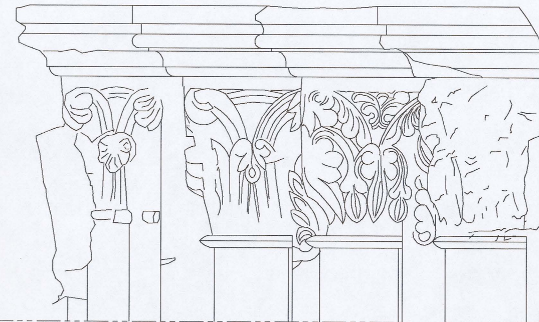
CAPITEIS 9 10 11 12