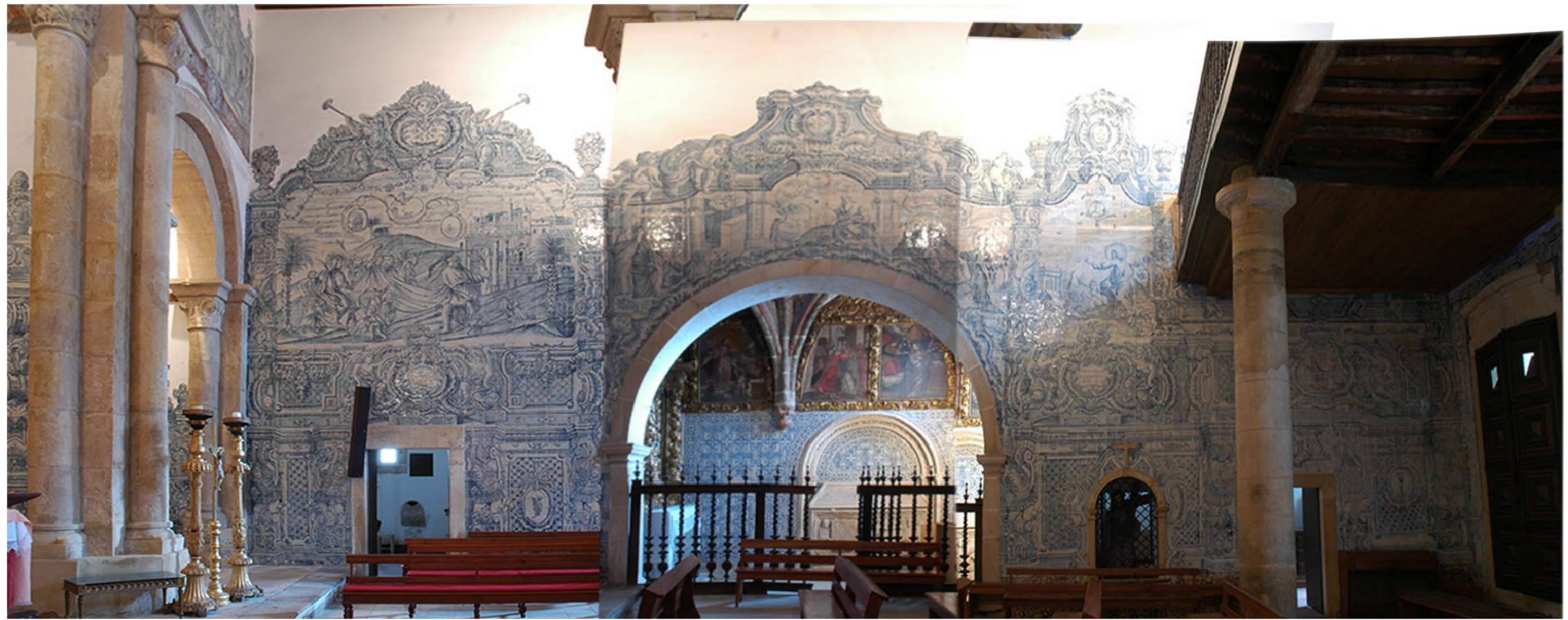
Vista Interior Direita