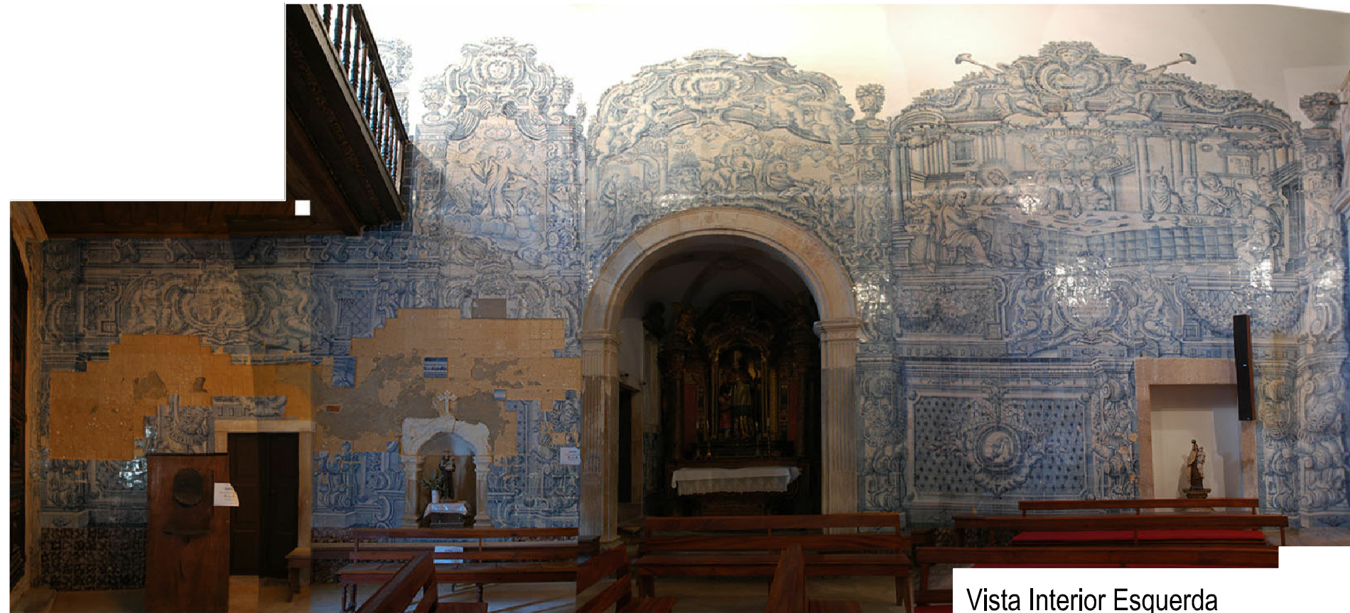
Vista Interior Esquerda