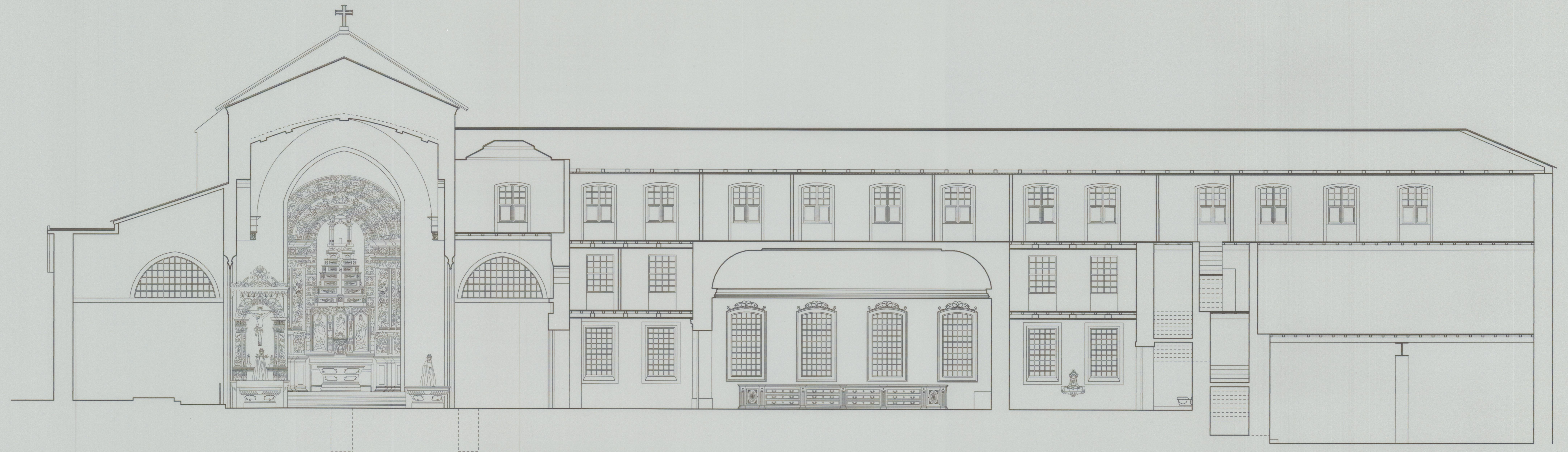
CORTE E - E