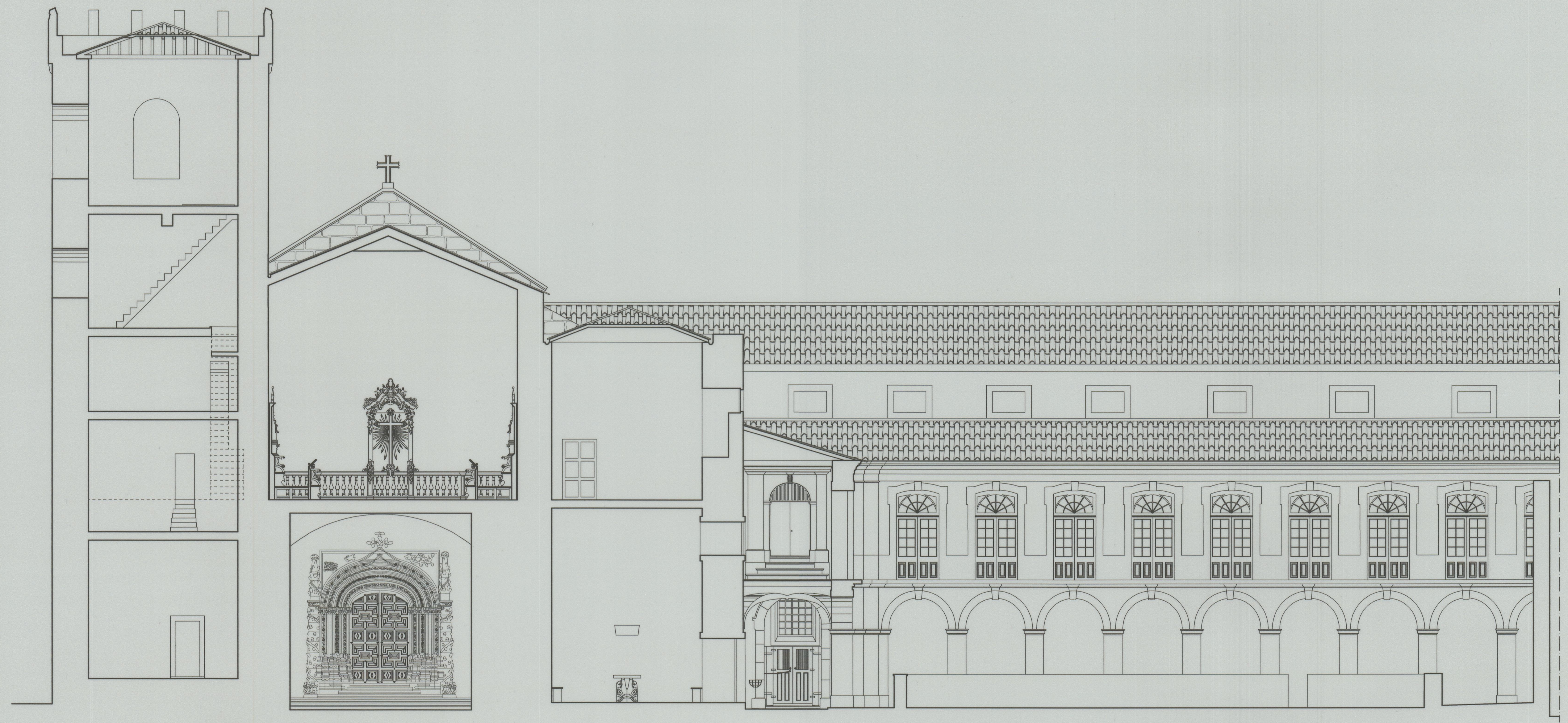
CORTE A - A