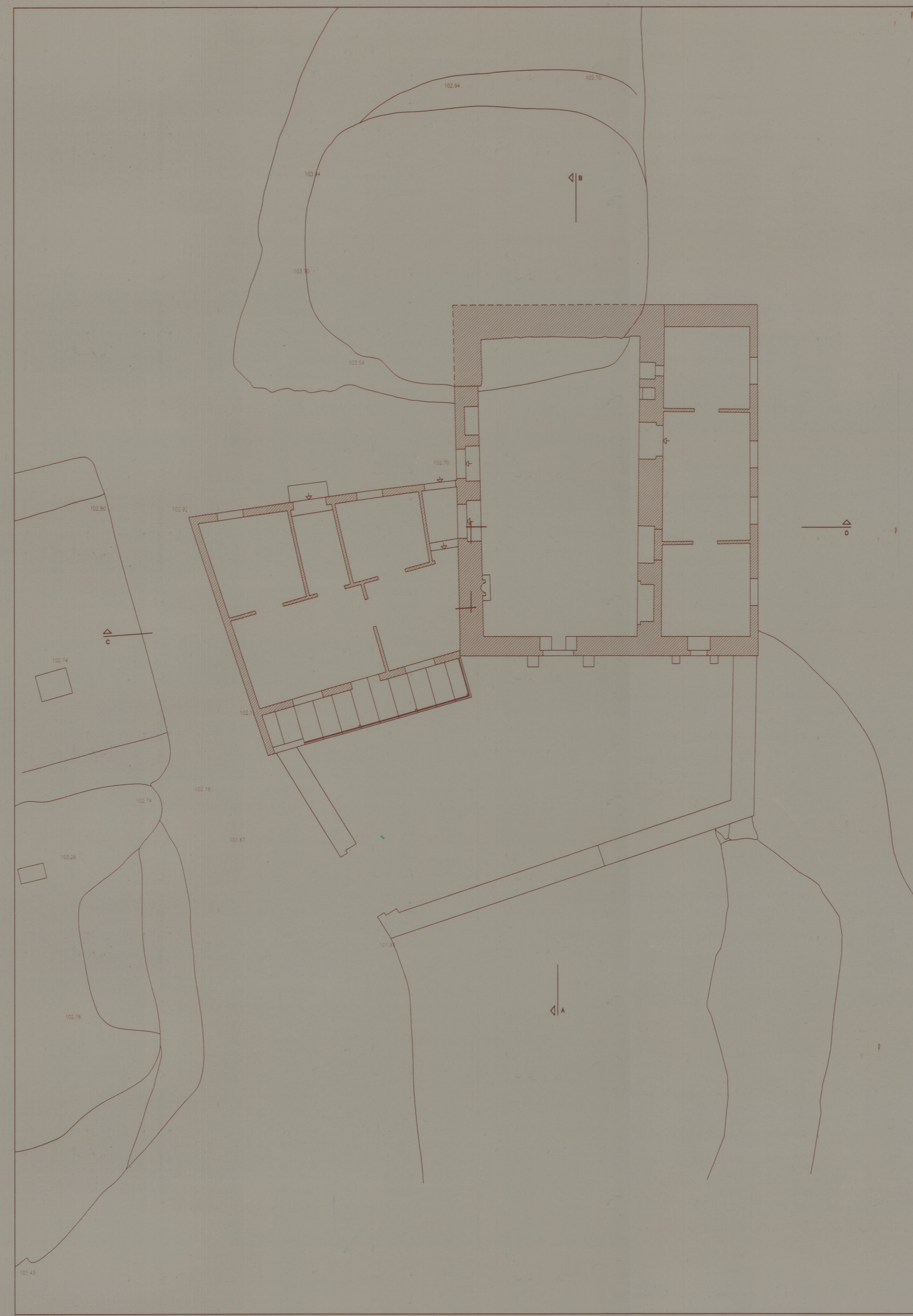
PLANTA PISO 2