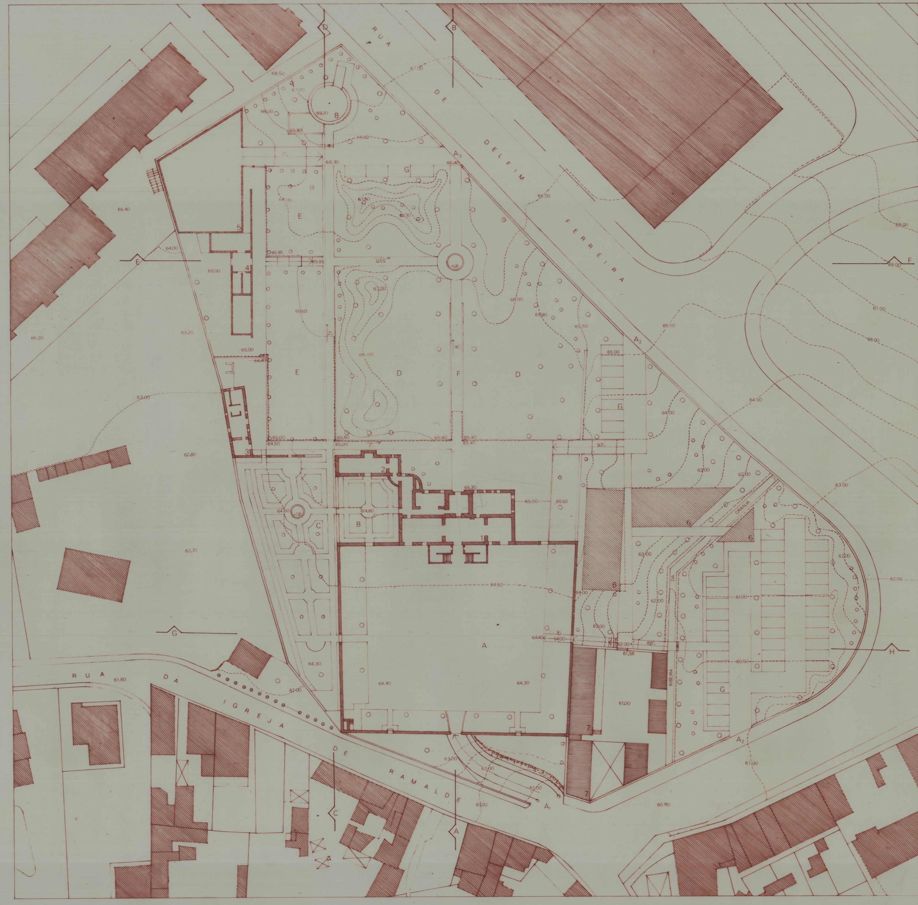
ESTRUTURA E MODELACAO PROPOSTA