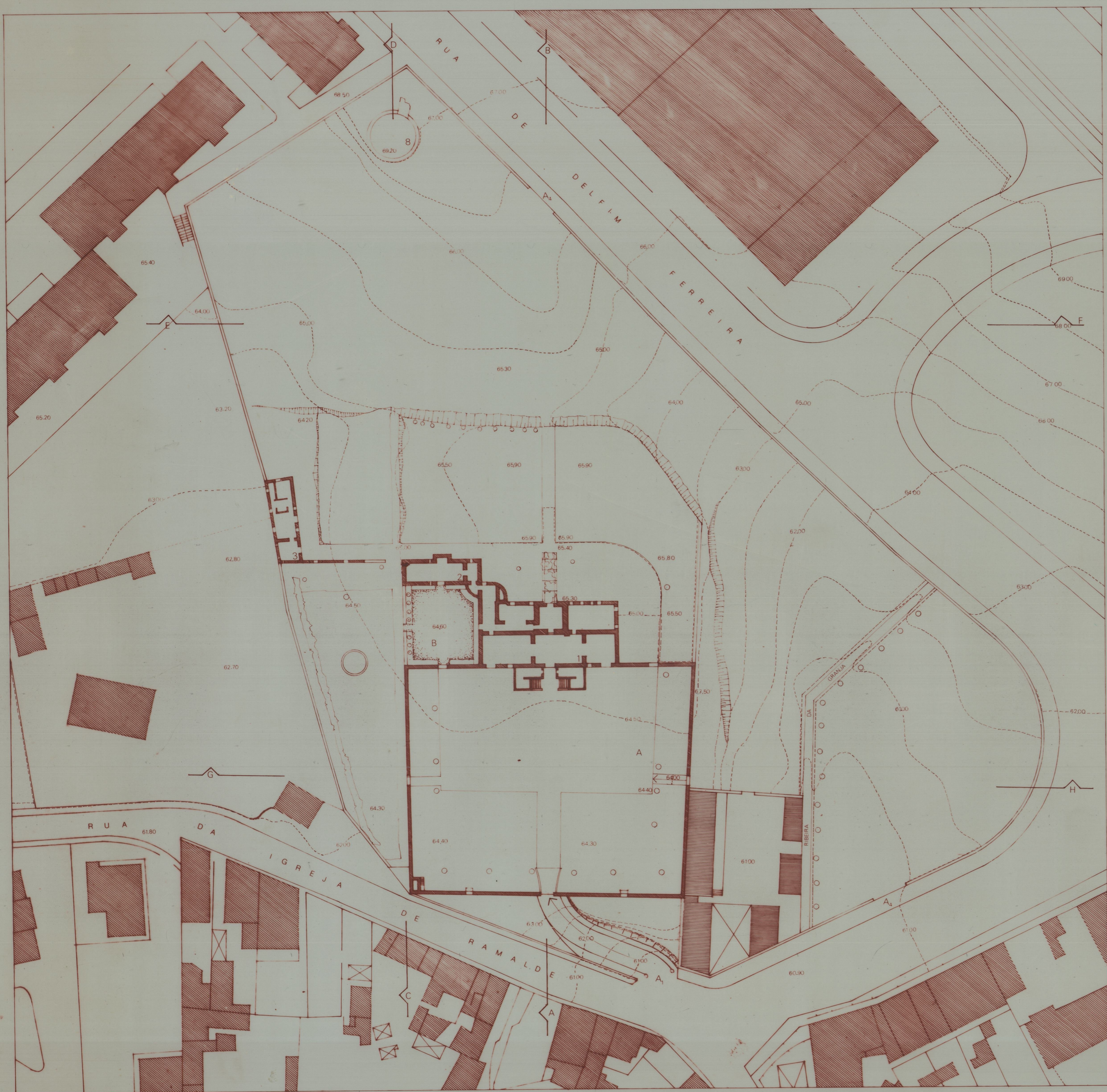
ESTRUTURA E MODELACAO EXISTENTE