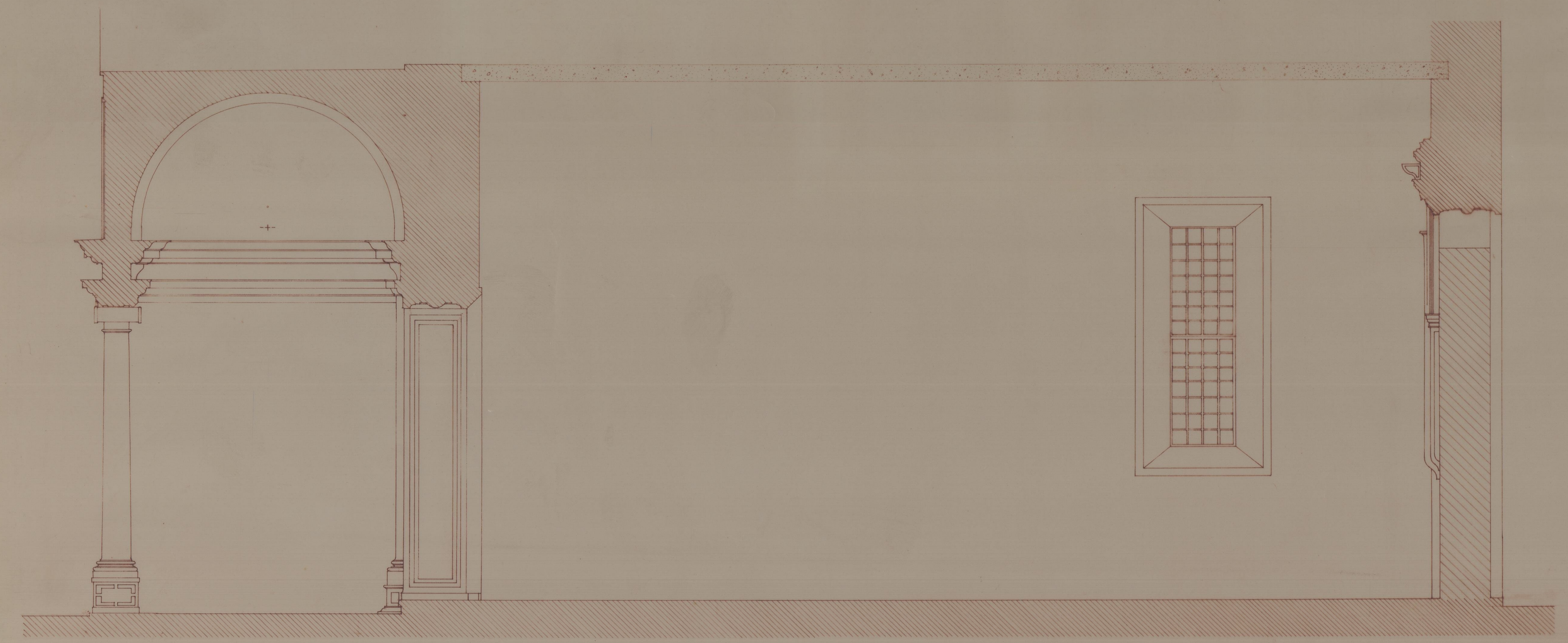
ALÇADO NORTE - CORTE AB