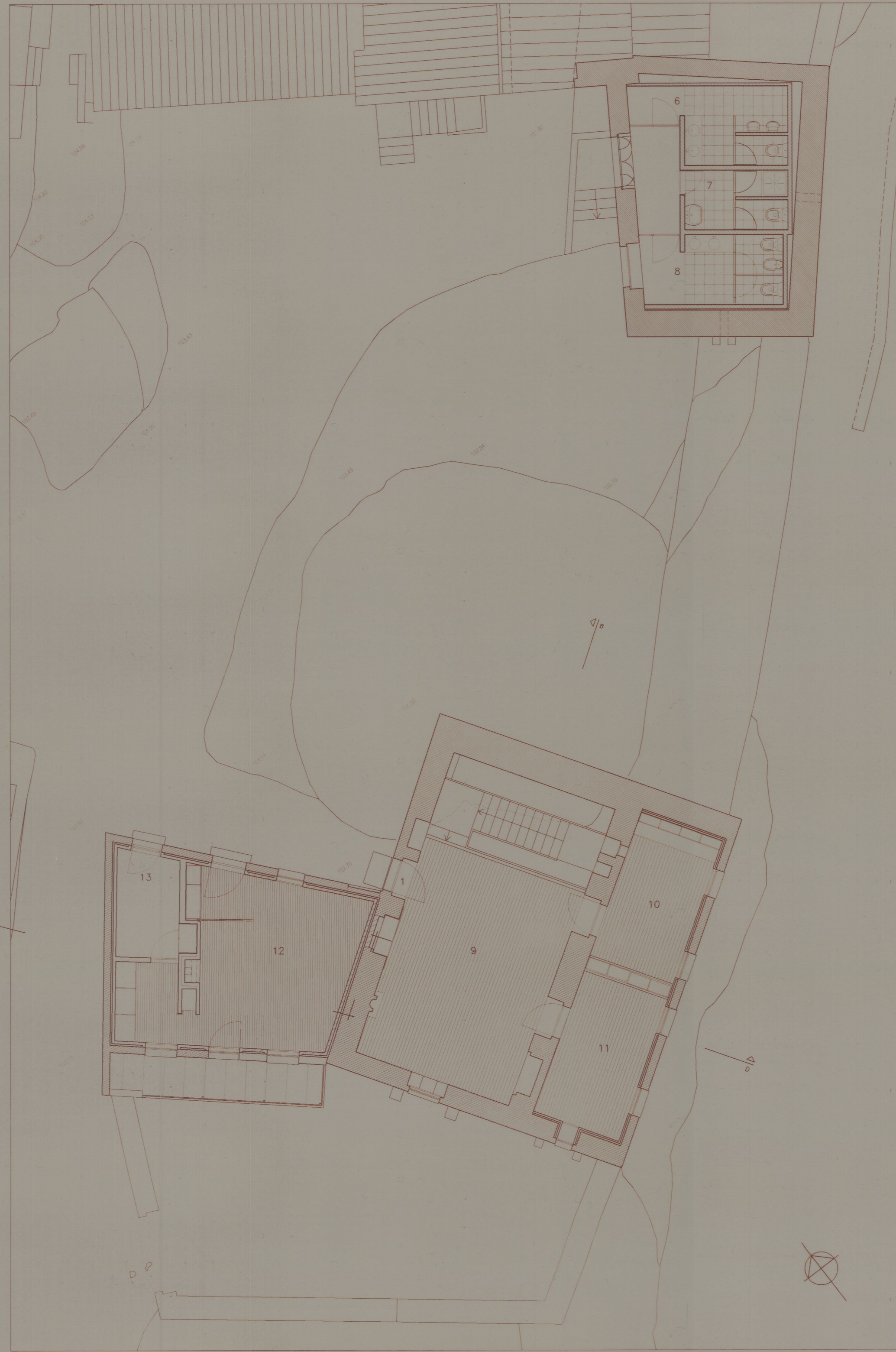
PLANTA PISO 2