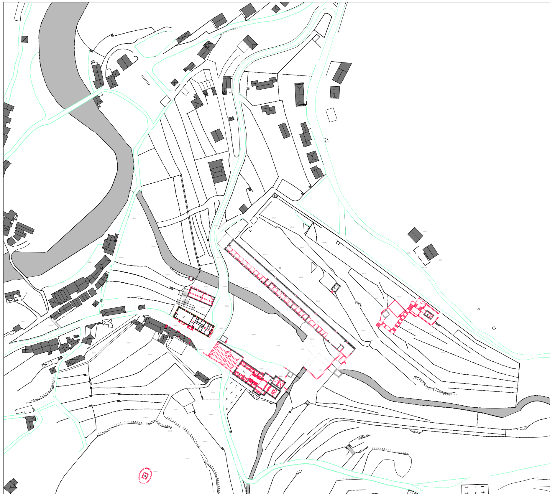
PLANTA DE IMPLANTAÇÃO