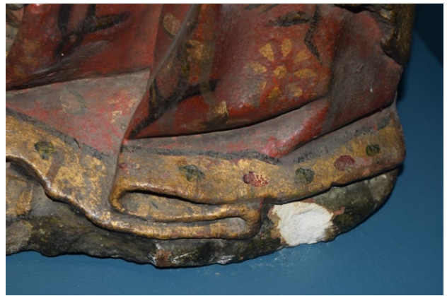
[fig. 8] Suporte: lacuna na base.