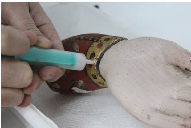
[fig. 17] Suporte. Injeção de resina.