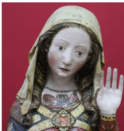
[fig. 1] “Nossa Senhora do Ó.” Fotografia © Cinábrio [fig. 2] “Nossa Senhora do Ó” – pormenor do rosto. Fotografia © Cinábrio