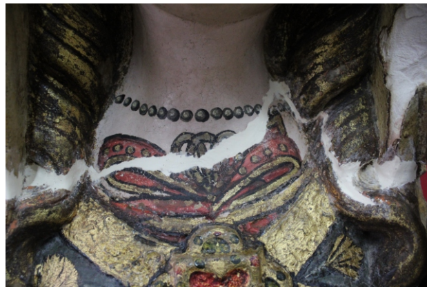
[figs. 15 e 16] Remoção do repinte. Preenchimento de lacunas.