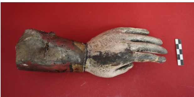
[fig. 9] Antebraço esquerdo em madeira.