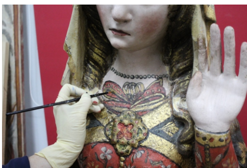
[fig. 26] Aplicação de verniz.