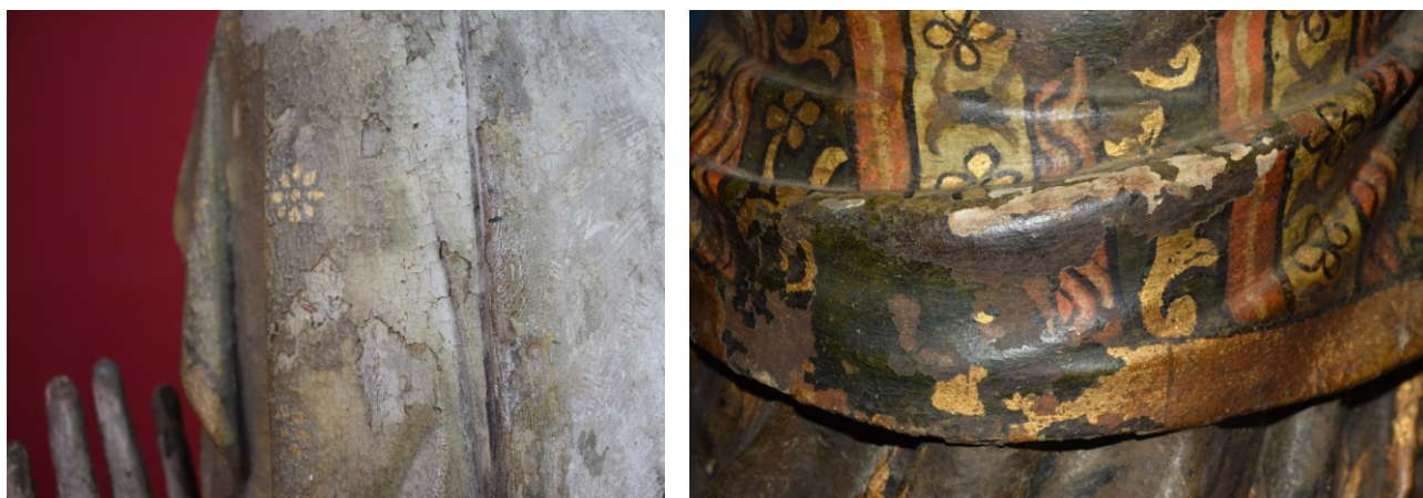
[fig. 3] Policromia (véu): destacamento; lacunas. [fig. 4] Policromia: lacunas; sobreposição de camadas.

forma predominantemente hexagonal, mas de carácter coeso. A convivência de duas intervenções de carácter distinto quanto à sua qualidade técnica e material não é incomum na escultura, existindo diversos casos onde as duas intervenções coexistem (Bidarra, 2014) (Cerdeira et al, 2019: 16).