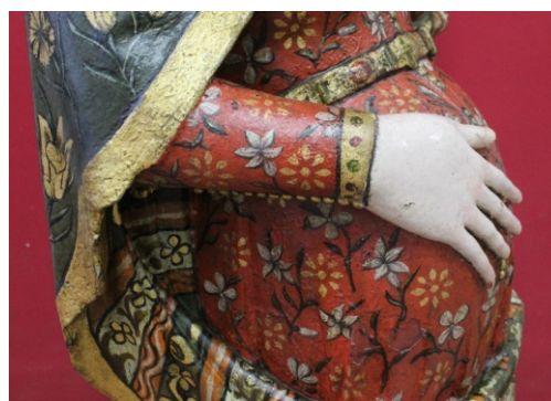
[figs. 12 a 14] Policromia: limpeza.