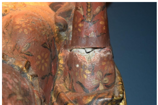
[fig. 10] Repinte.