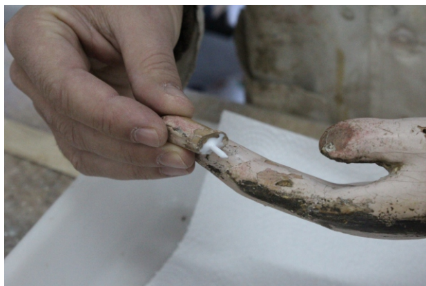
[fig. 18] Colagem.

Existiam ainda outros dois orifícios. O primeiro localizado no material pétreo, na zona de união do antebraço com o braço, e que se encontrava preenchido com massa, e um segundo na base do antebraço em madeira, e coincidente com a furação existente na pedra. A utilização desta furação promovia uma união mais adequada entre as partes, pelo que foi reutilizada.