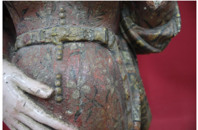
[figs. 5 e 6] Policromia: verniz alterado; acumulação de sujidade.