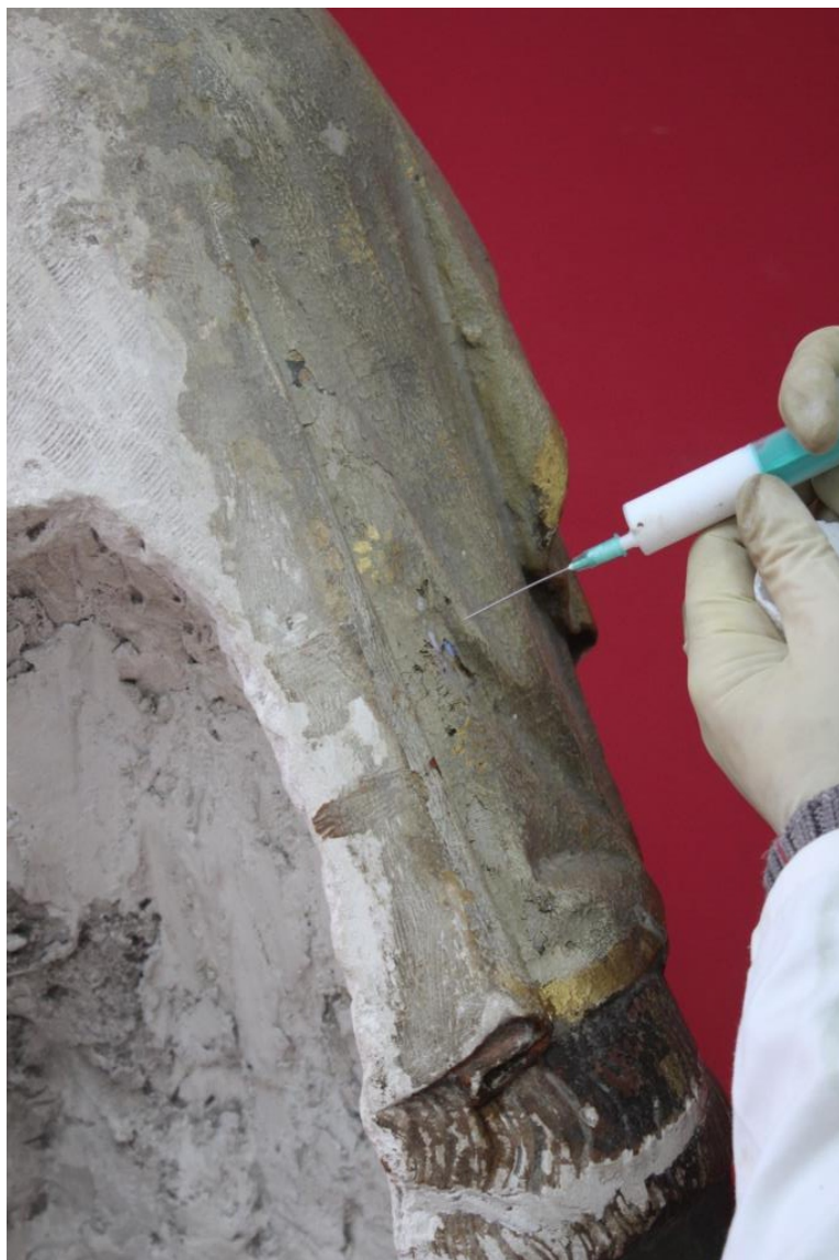
[fig. 11] Fixação da policromia.