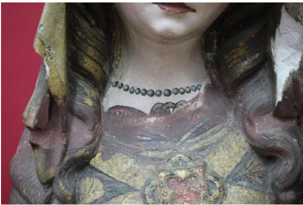
[fig. 7] Policromia: repinte.