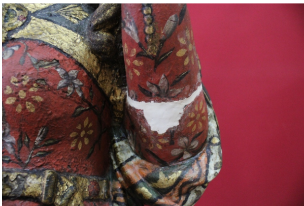
[figs. 19 a 24] Fixação do antebraço em madeira.