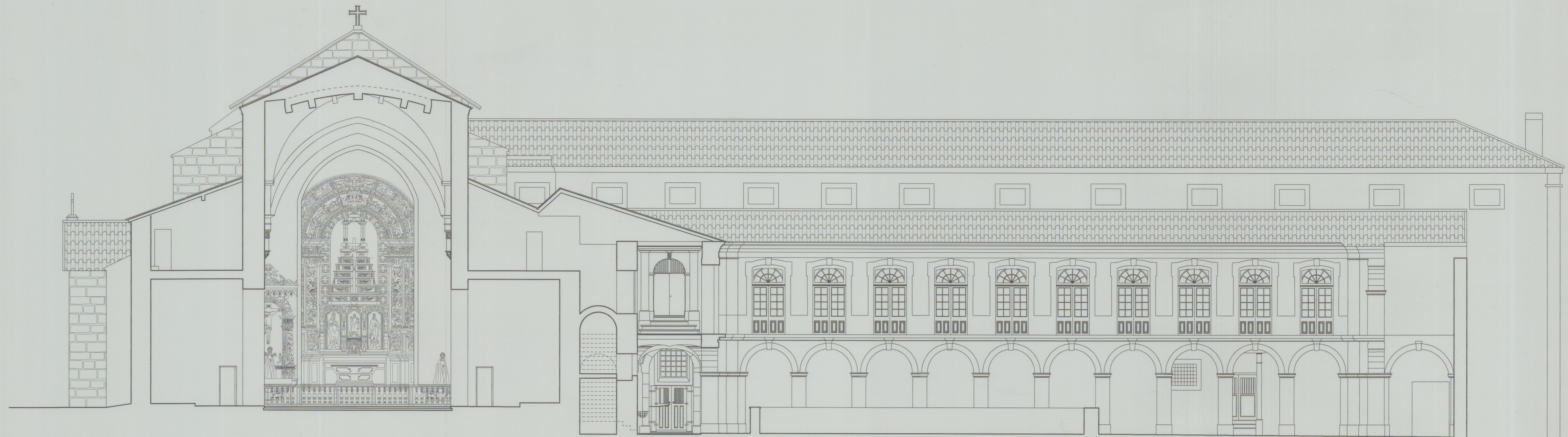
CORTE C - C