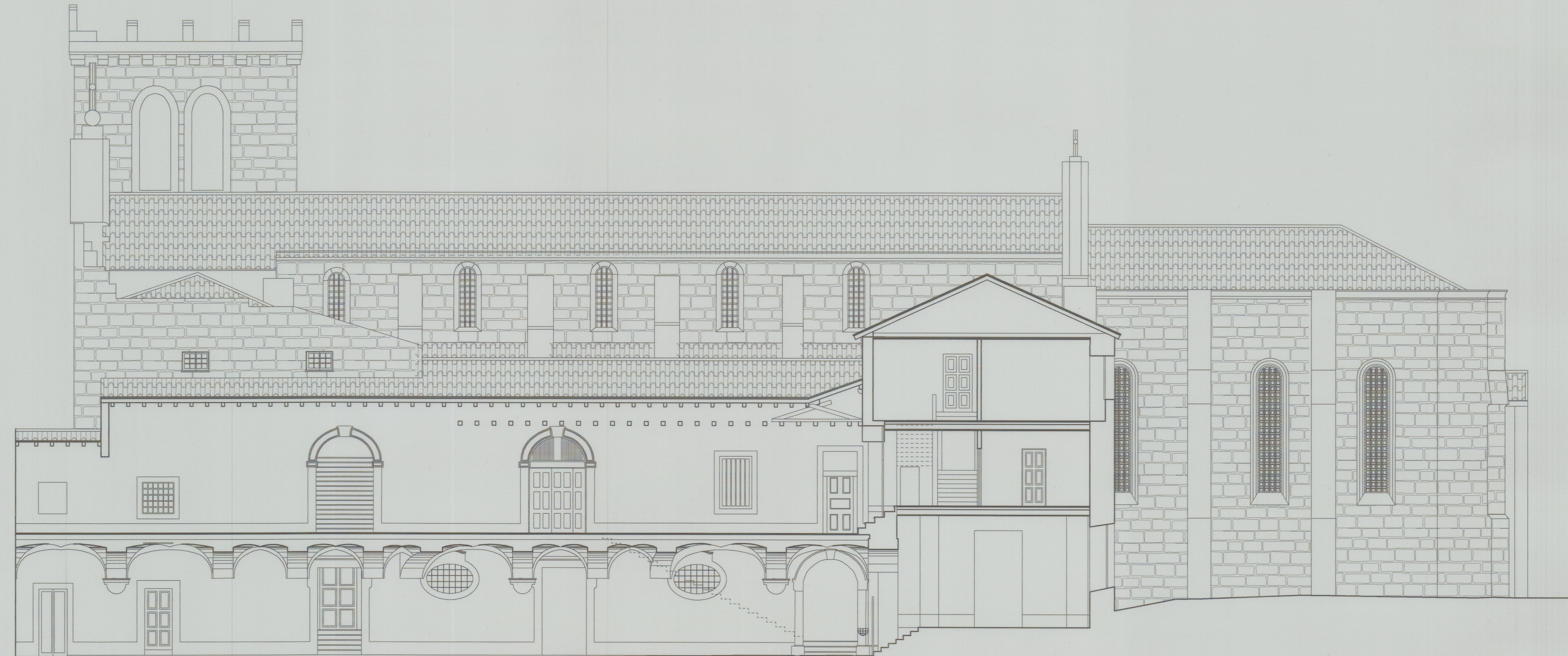
CORTE I - I