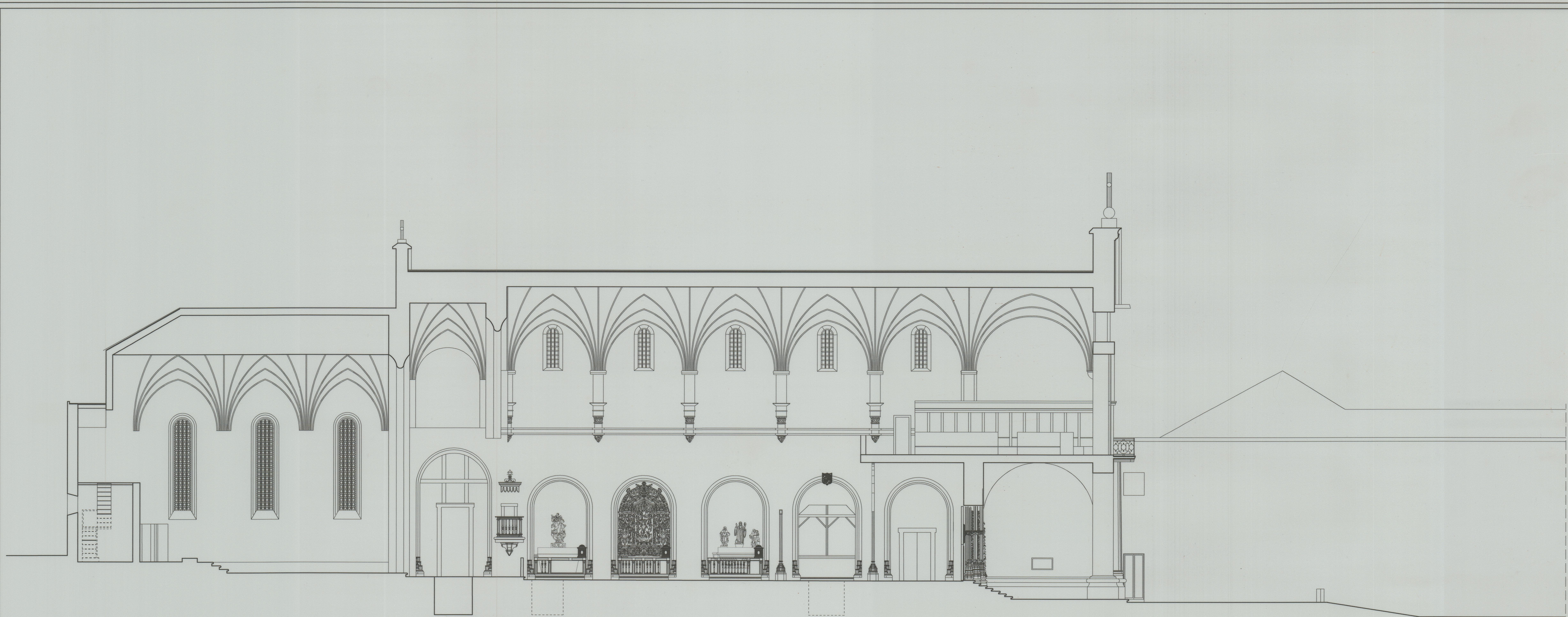
CORTE L - L