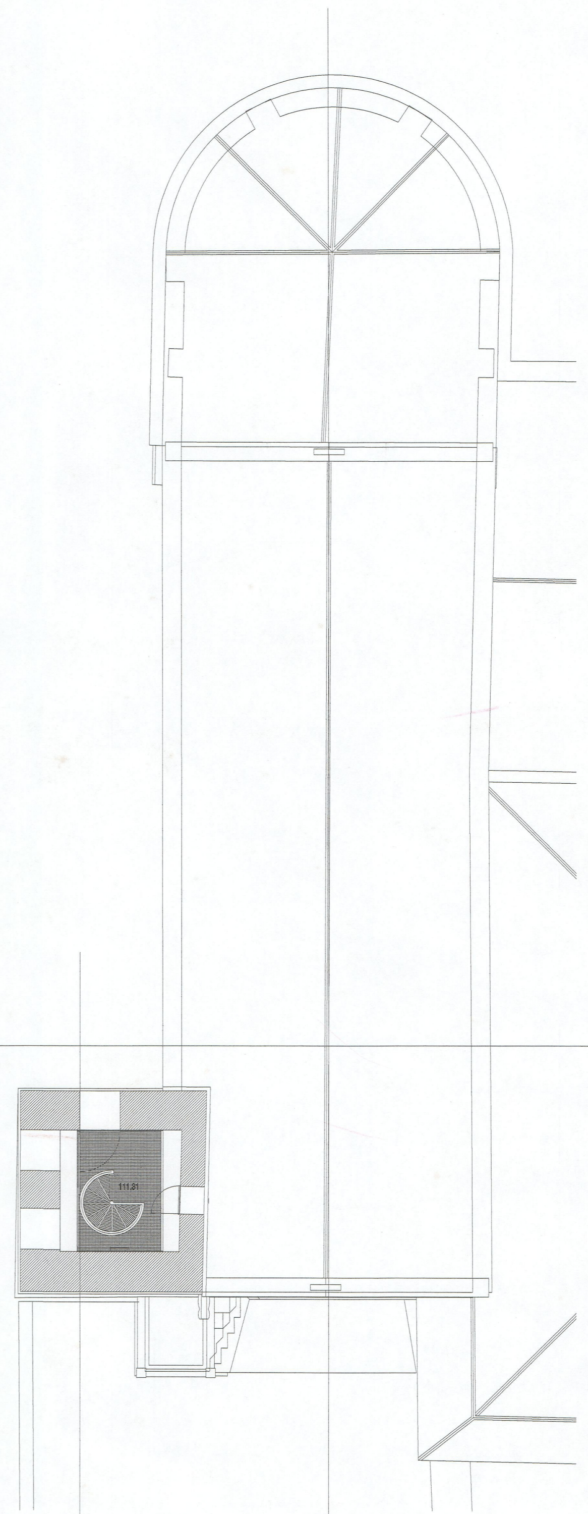
PLANTA DA TORRE - (cota 113.00)