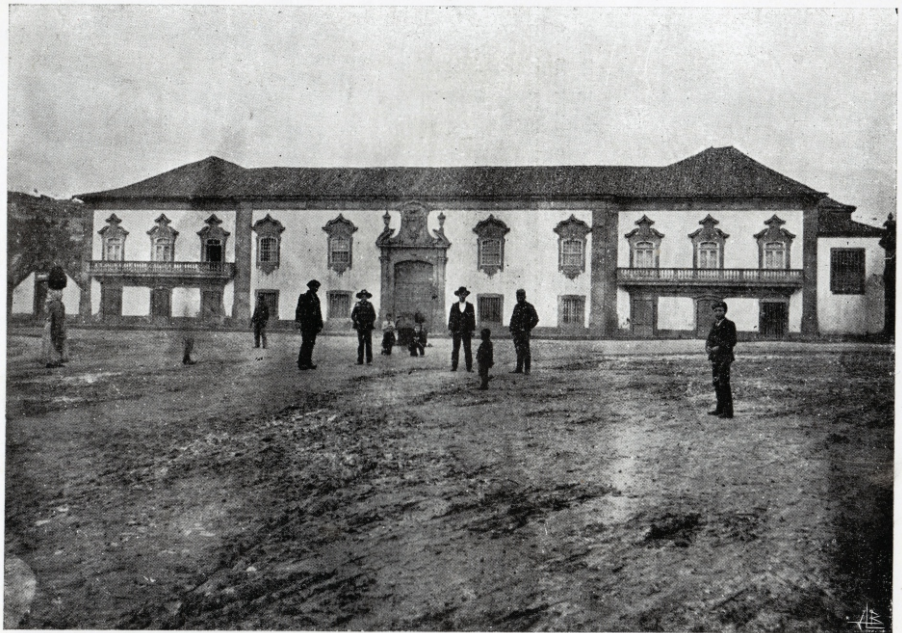
Fachada do Paço Episcopal

Reproduzida no opúsculo «O Paço Episcopal de Lamego», de José Júlio Rodrigues 71 , este cliché, possivelmente do autor do texto, é um curioso registo topográfico de um Rossio despido de qualquer ornamento – simples terreiro enlameado que contrasta com o volume horizontal do palácio dos bispos. À sua frente, dispostos como manequins, homens, rapazes, crianças e uma mulher transportando um fardo à cabeça, dispersam-se pelo cenário. Entre os homens destacam-se dois soldados, provavelmente de Infantaria 9 e das 4 crianças, duas aparecem ajoelhadas, aparentemente puxando algum veículo, posicionado atrás deles. Podemos pensar que esta imagem se reportasse a uma vulgar cena de rua, mas o posicionamento das figuras sugere que o fotógrafo quis fazer uso dos corpos como escala para aferir da extensão lugar e das dimensões do edifício. O autor da fotografia do Seminário, para o bilhete-postal ilustrado n.º 2 editado pela Loja Vermelha, fez o mesmo, posicionando frente à actual messe, homens crianças e mulheres que olham directamente para a câmara – entre os indivíduos alguns militares que, aliás, são elementos comuns nas primeiras fotografias tiradas em Lamego 81 .