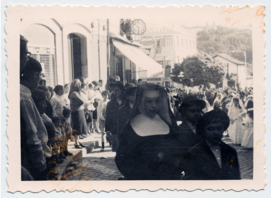
Imagem XIX – [Sem indicação de autoria] – «Lamego» [manuscrito a bolígrafo no verso], [sem data]. 1 positivo fotográfico 6,3,4x6,3cm (cada positivo); 9,9x7 cm; p&b.

Em «Arcas Encoiradas», depois de recordar as imagens mudadas na memória da sua cidade de Lamego Aquilino conclui: «Isto passou-se há coisa de meio século. Que digo eu, há um imenso ror de anos! Ao ritmo que leva o mundo, à mutação que se deu nas cidades e nos homens, nessa altura estava-se mais perto da Idade Média do que dos nossos dias» /34/ .