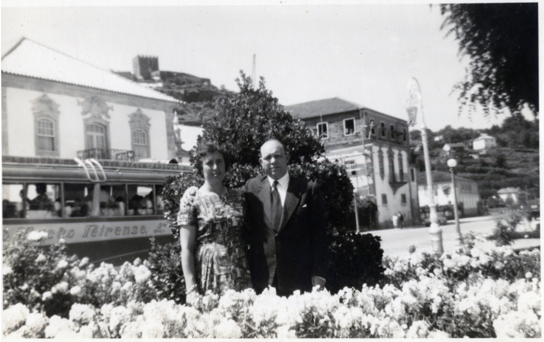
Imagem IV – [sem indicação de autoria] - «Lamego» [indicação manuscrita no verso], [sem data]. 1 positivo fotográfico: 13,4x8,6 cm; p&b.

O tempo das excursões em carro ou autocarro (a «camioneta») – já o século XX ia avançado - abriu o país aos de cá, que passaram a poder deixar as suas terras sem ser por obrigações económicas ou morais – coisa impensável para o homem de há 100 ou 200 anos, nado e morto à sombra do seu campanário. Na fotografia um casal de excursionistas posa entre os canteiros floridos de um Rossio muito diferente do da fotografia de 1908 e muito distante do tempo de D. Manuel de Noronha, que ali pôs formoso tanque de mármore. Mas a tudo sobrevive o Castelo, recorte dentado no horizonte, como sentinela que vigia o tempo. E, depois de tirada a fotografia lá partiu com a gente o autocarro da Auto Viação Feirense, do mesmo sítio onde ainda hoje partem e chegam muitos autocarros de turismo.