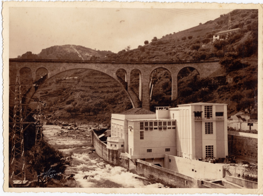
Imagem XII – Silva Regua [assinatura manuscrita no positivo] – [sem indicação de título ou designação], circa 1960 [indicação de data manuscrita no verso: 12.Abril.1960]. 1 positivo fotográfico: 23x17 cm; p&b.

A linha ferroviária da Régua a Lamego constituiu parte de um projecto de ligação que pretendia estabelecer uma via no sentido norte-sul, unindo o Douro à Beira Baixa. Nunca passou do papel, mas o que mais tarde viria a ser designado «ramal de Lamego», entre esta cidade e o importante núcleo ferroviário já formado desde o século XIX no Peso da Régua, foi praticamente concluído (entre 1927 e 1934), pelo menos nas suas principais e maiores infraestruturas, como a ponte sobre o Douro (hoje rodoviária) e esta bela ponte em curva, sobre o rio Varosa.