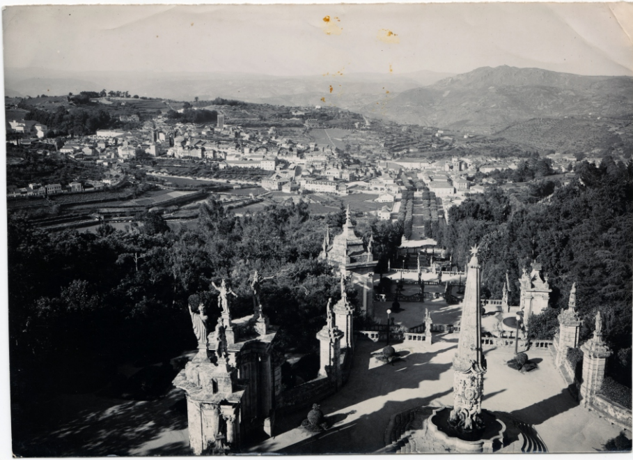
Imagem II – [Sem indicação de autoria] - «Lamego / Vista tirada do alto do Santuário dos Remédios» [indicação manuscrita no verso], [sem data]. 1 positivo fotográfico: 17x12,2 cm; p&b.

Esta é, provavelmente, uma das vistas mais reproduzidas da cidade [2] . Não poderia ser de outra forma: do Santuário toma-se a cidade, e ele prolonga-a como de resto seria vontade de D. Manuel de Noronha ao reavivar, no século XVI, o culto e o poder episcopal na encosta frente ao seu Paço. Questão de poder, ou não, a devoção impôs-se e malgrado a hierática e ameaçadora pose das balaustradas, dos pináculos, dos coruchéus, das colunas e das esculturas – que, quer Erico Veríssimo [3] , quer José Saramago [4] associaram às esculturas do brasileiro Aleijadinho –, é a horizontalidade do arvoredado das copas da mata que chama a atenção, avassaladora mancha a quem recorriam os romeiros no ainda cálido tempo da festa mariana como descreve Aquilino em 1908 [5] ou que acentua a ideia de «cidade verde» como lhe chama João de Araújo Correia [6] .