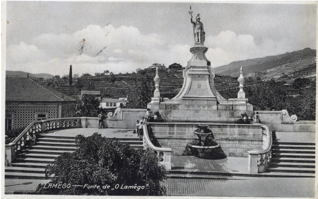
Imagem XVI – «LAMEGO- Fonte de “O Lamêgo”»). [Bilhete-postal ilustrado]: Edição Registada do Santuário dos Remédios e Câmara Municipal]. [Alemanha], [sem data]. 1 postal: 9x14cm: p&b. Circulado com data de 1939; manuscrito no verso, APIF | Nuno Resende ©.

Em tempo de República, o bairro alto de Lamego recebeu os maiores cuidados para impor-se como a parte laica da cidade. Ao antigo campo do Tablado, mesmo em frente ao edifício dos Paços do Concelho (onde outrora houvera feira e festa a São Sebastião) chamou-se praça da República depois de 1910, mas já antes a intervenção para contrapor elementos civis ou laicos ao edifícios e símbolos religiosos da cidade baixa, se viera fazendo, nomeadamente durante o consulado do Visconde Guedes Teixeira (1843-1890).