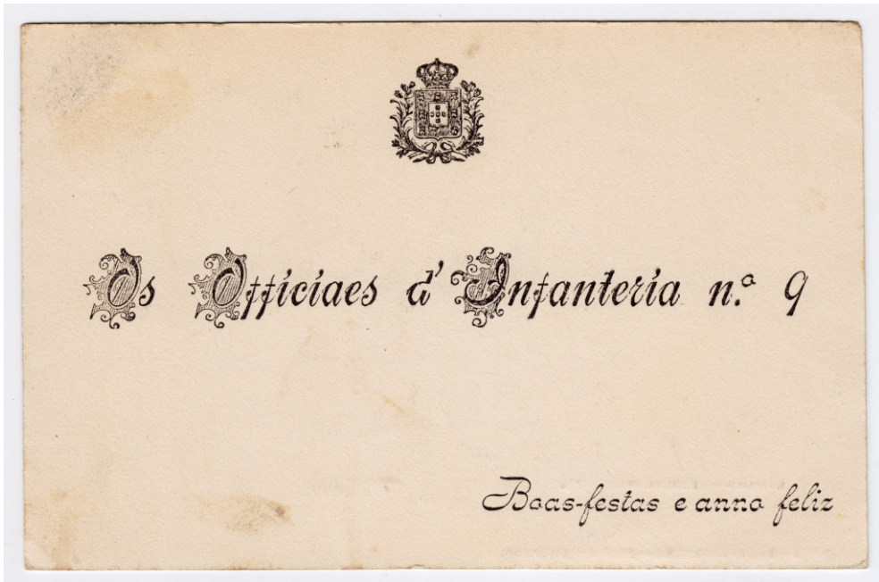
Imagem X – «LAMEGO – AVENIDA MARIA PIA / N.º 3 – LOJA VERMELHA – JOSÉ DE MENEZES» [bilhete-postal ilustrado: verso]: [Loja Vermelha]. [Lamego], [sem data, anterior a 1910]. 1 postal: 9x13,9cm: p&b. Não circulado; no verso: «Os Officiaes d'Infanteria n.º 9», APIF | Nuno Resende ©.

Talvez como complemento à imagem anterior (imagem IX) se deva mostrar o que habitualmente não interessa ou não se vê num bilhete-postal ilustrado: o verso. Neste caso trata-se do verso do BPI n.º 3 da coleção editada pela Loja vermelha de José de Menezes, apresentando a nova «Avenida Maria Pia» (hoje avenida 5 de Outubro). Este bilhete parece ter sido adaptado para receber, não os tradicionais campos de escrita e direcção, mas uma mensagem tipográfica de boas festas e de novo ano, emitida pelos oficiais de Infantaria 9. No topo do bilhete, as armas do reino de Portugal. Trata-se, portanto, de documento anterior a 5-10-1910 e clara afirmação do Batalhão de Infantaria 9 como instituição lamecense, dela integrante e dela representante pelo menos desde 1839, ano em que foi transferido de Viana do Castelo para esta cidade 18/ .