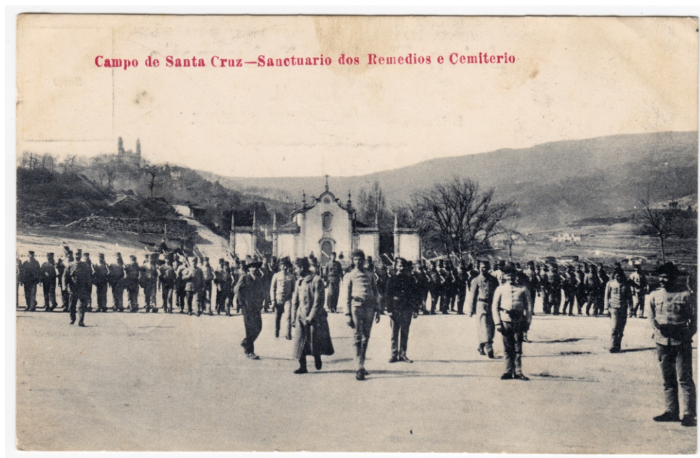
Campo de Santa Cruz—Sanctuario dos Remedios e Cemiterio