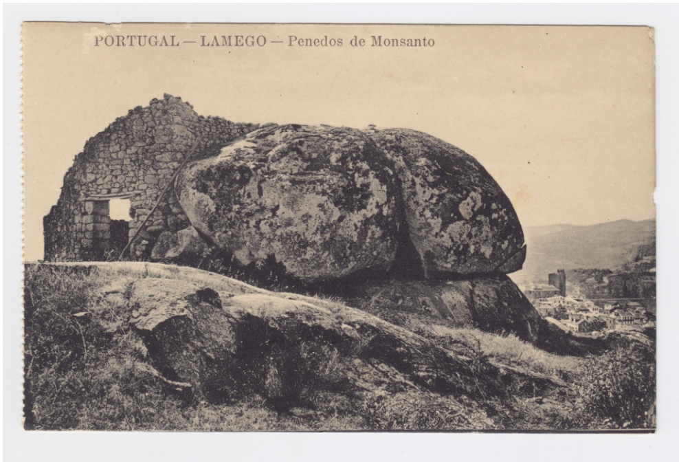
Imagem I – “PORTUGAL – LAMEGO – Penedos de Monsanto” [bilhete-postal ilustrado]: [sem indicação de editor]. [Sem indicação de local de impressão], [sem data]. 1 postal: 9x14cm: p&b. Não circulado; no verso: «Union Postale universelle – Bilhete Postal», APIF | Nuno Resende ©.

Embora este apêndice iconotopográfico não tenha um fio condutor que não o da sensibilidade do antologista antes as imagens e os significados possíveis da ideia de Lamego nelas presentes, talvez a que melhor possa abrir a série, seja esta dos «Penedos de Monsanto» 11 . A partir destas rochas, quase despercebidas no perfil urbano (e até há anos alguns distantes dele), traçou Rui Fernandes, no século XVI a circunferência por onde descreveu o pano de fina verdura que dizia ser o compasso de Lamego. Subir aqui para ver a terra é modernidade que o tratador de lonas e bordates d'El rei já entendia e fazê-lo neste Monte Santo e não em outro lugar (como a torre do Castelo ou a encosta de Santo Estêvão) é sinal de consciência geográfica e de abertura ao Douro, num tempo em que a cidade era (da) serra (como se vê pela imagem).