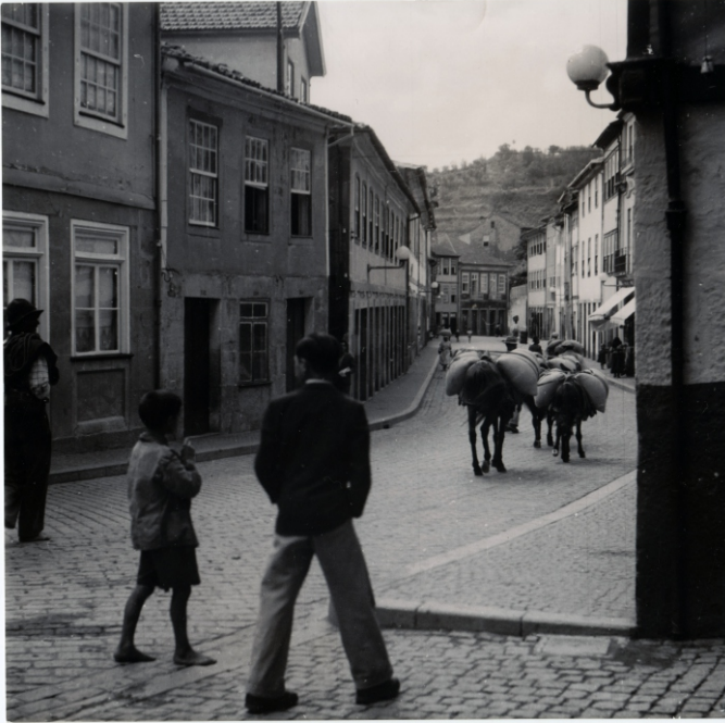
Imagem VI – Photo Goldner (Paris) - «Une rue de Lamego» [indicação manuscrita no verso], [sem data]. 1 positivo fotográfico: 18,1x18,2 cm; p&b. APIF| Nuno Resende ©.

A rua da Corredoura (actual Rua de Cardoso Avelino), parte de um extenso e sinuoso corredor que liga o couto da Sé aos seus limites, é, ainda hoje, uma das principais entradas e saídas da cidade, caminho da Beira. Rua mista de elites e povo, hoje particularmente barulhenta de automóveis – atesta o antologista que lá viveu um ano em 2005 – abre-se nesta janela fotográfica como um recorte intemporal da cidade aquiliniana ou torguiana. Pelo menos Aquilino por ela entrou pela primeira vez na cidade, tomando consciência, logo à sua boca, da crua realidade da gente que sobrevivia na calçada ao bairro da Ponte – núcleo humano arredado das vistas e descrições mais frequentes de Lamego (imagem XVIII). Fotografia humanista de autor estrangeiro, podia incluir-se no portefólio desse retratista sentimental que foi o cónego Correia de Noronha 121 , o qual António Sena incluiu entre os nossos poucos e hábeis documentaristas da imagem 131 .